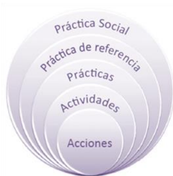
Figura 1. Modelo de anidación de prácticas (Cantoral, 2013)

Para articular la construcción social del conocimiento, es decir, la construcción del saber, se articulan los siguientes principios uno detrás de otro: se pasa de la acción , directa del sujeto (individual, colectivo o histórico) ante el medio en tres acepciones: material (entorno), organizacional (contexto), social (normativo), esto se organiza como una actividad humana situada socioculturalmente, para perfilar una práctica (iteración deliberada del sujeto y regulada por el contexto); dicha práctica cae bajo la regulación de una práctica de referencia que es la expresión material e ideológica de un paradigma (ideológico, disciplinar y cultural), la que a la vez es normada mediante cuatro funciones por la práctica social (normativa, identitaria, pragmática y discursiva–reflexiva). Esta secuencia permite explicar empíricamente y teóricamente el proceso de construcción del sujeto individual, el sujeto colectivo y el sujeto histórico. A la vez que permite intervenir prácticamente y transformar los procesos didácticos a fin de favorecer la construcción social del conocimiento matemático. Esto puede observarse en la siguiente figura.