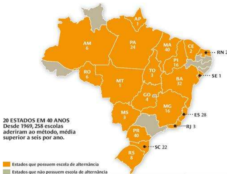
Figura 3. Mapa demonstrativo do número de escolas CEFFAs nos estados brasileiros que aderiram a Pedagogia da Alternância; Fonte: Revista Nova Escola, 2008.

Diante da expansão e de muitas formas de reconhecimento e uso da pedagogia da alternância é necessário trazemos à discussão alguns aspectos que tentam dar-lhe feitura e sentidos como parte de sua funcionalidade frente os CEFFAs, já que o nosso lócus de pesquisa adota a pedagogia da alternância em seu processo de ensino.