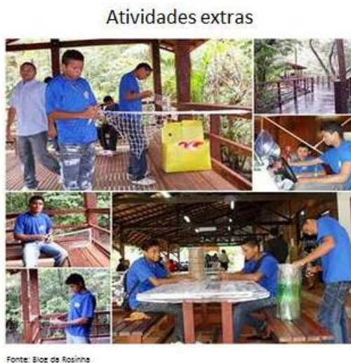
Figura 2. Alunos tecendo redes de pesca artesanal.

Tendo em vista, ainda, a composição de um potencial agrícola-pesqueiro, característica pela qual a escola foi implementada, a CEPE conta com as experiências dos alunos pela prática social sobre o processo da pesca – figura 2, permitindo a reciprocidade de ideias e experiências entre os sujeitos ingressos nela.