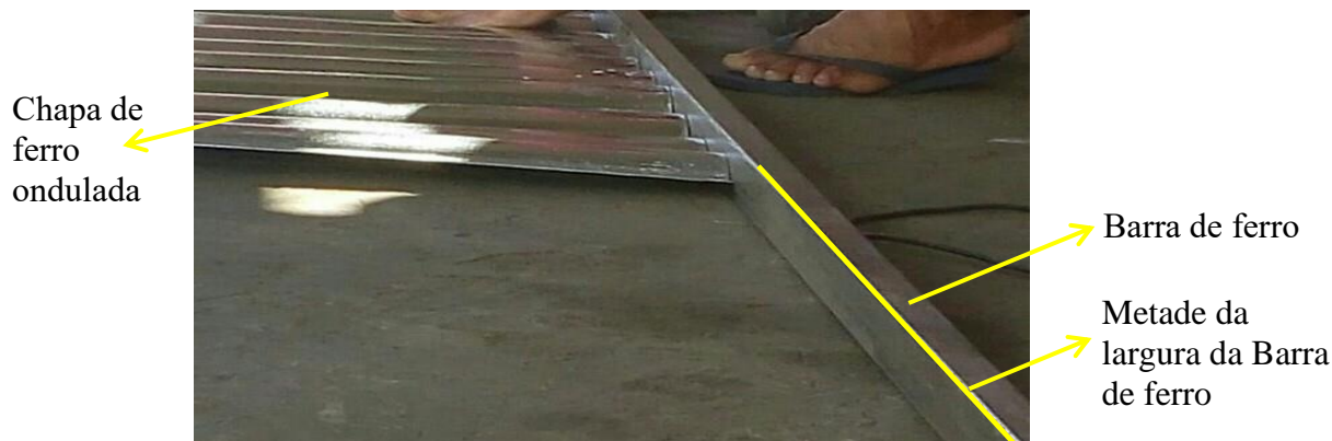
Fotografia 4. Situação problema

Uma das situações problemas enfrentados pelo senhor Bentes que observamos durante desenvolvimento da pesquisa se refere à necessidade de soldar uma chapa de ferro ondulada na metade da largura de uma barra de ferro, como podemos visualizar na fotografia 4.