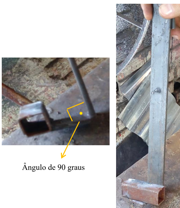
Fotografia 5. O gabarito construído

Na fotografia 5, podemos visualizar o gabarito construído pelo senhor Bentes para resolver a situação-problema.