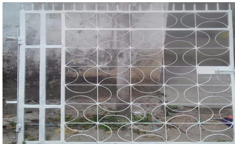
Fotografia 2. Grade construída com a ajuda do gabarito

O uso do gabarito assegura que as semicircunferências produzidas para o desenho da grade tenham medidas iguais, isto é, o mesmo raio, diâmetro e comprimento. Na fotografia abaixo podemos visualizar a grade já pronta cujo traçado ornamental foi produzido pelo gabarito.