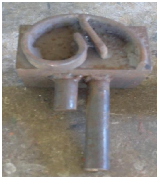
Fotografia 3. Gabarito de curva

Na fotografia 3, podemos visualizar mais um gabarito construído pelo senhor Bentes para ser utilizado no desenho de uma grade.