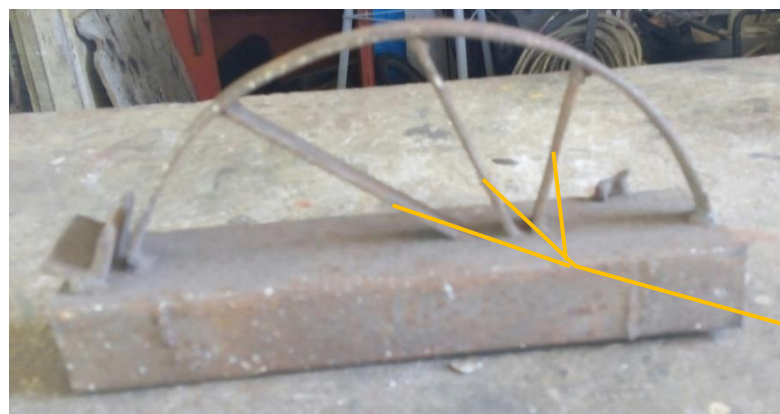
Fotografia 1. Gabarito de semicircunferência

A função desse gabarito é servir de suporte e molde para o serralheiro dobrar as barrinhas de ferro que serão usadas na construção da grade. Ao analisarmos esse instrumento notamos a concretização de conhecimentos, inclusive matemáticos, que foram mobilizados no seu processo de construção que são fundamentais para o serralheiro definir o comprimento, a espessura e a curvatura da forma.