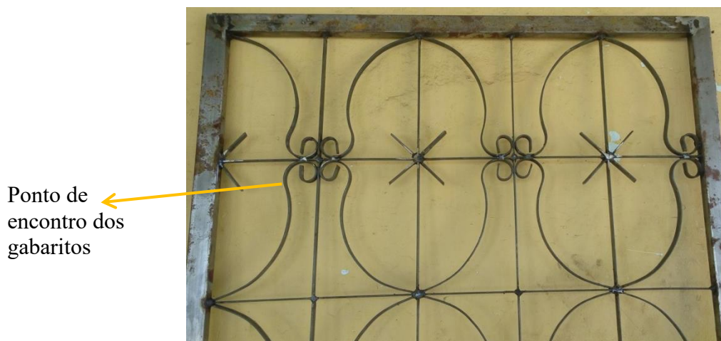
Fotografia 4. Grade construída com a combinação dos gabaritos

Para a construção da grade vista na fotografia 4, o senhor Bentes usou os dois gabaritos vistos nas fotografias 1 e 3, combinando assim a semicircunferência com a curva aberta. Na fotografia 4, podemos visualizar o traçado ornamental que resultou dessa combinação.